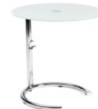
De centro regulable