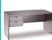
Mesa despacho 120cm