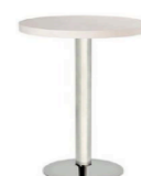
Mesa bar Copa